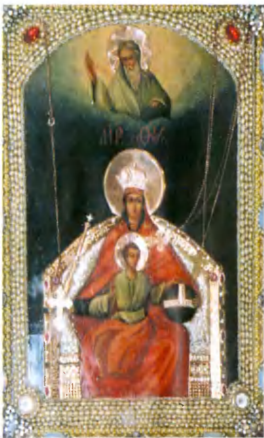
Икона Божисй Матери «Державная», копия иконы, находящейся в Коломенском.

можете теперь свободно купить и читать Евангелие, Библию и другую православную литературу. Открываются вновь отремонтированные храмы с золотыми куполами и крестами, красивые по своей архитектуре. В храмах старых и новых, больших и малых стало много людей, желающих