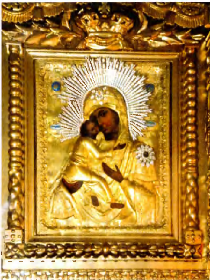
Отреставрированная икона Божией Матери «Владимирская».

подкрепляемое малочисленным приходским клиром в годы лихолетья, смогло донести до нас православную веру в ее чистоте. Дышать стало легче и свободнее, во вновь открываемых храмах зазвонили колокола, зовущие нас к молитве. Вы