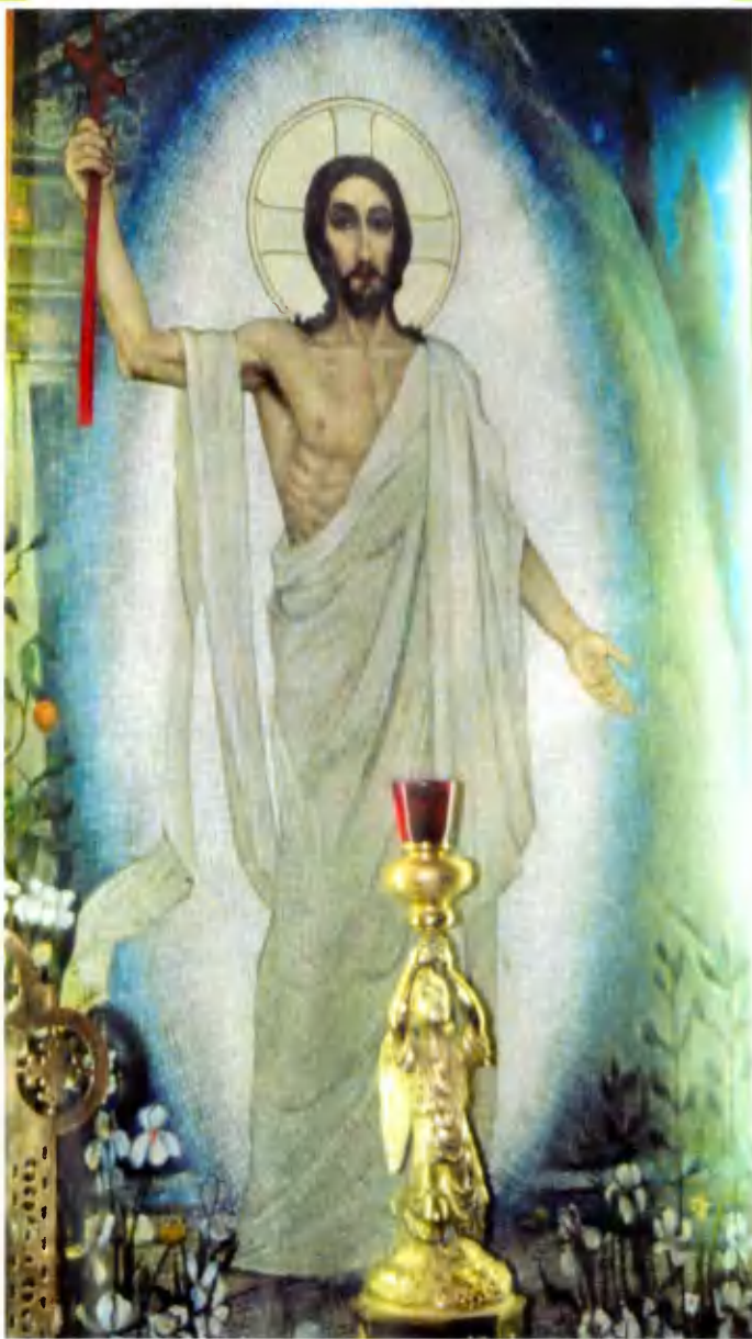
Главный алтарь. Икона Спасителя. Мозаика.