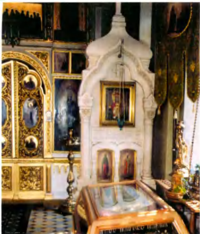
Придел прп. Параскевы Сербской. Плащаница Спасителя.

мой, существующей и поныне. После всех перестроек храм внешне приобрел очертание креста: впереди — главный алтарь, выходящий на восток, слева и справа — приделы Параскевы Сербской и Сергия Радонежского — небесных покровителей. С западной стороны находится вход с крыльцом, украшенным литыми чугунными колоннами и наверху иконой Святой Троицы, освящающей всяк входящего в сей храм.