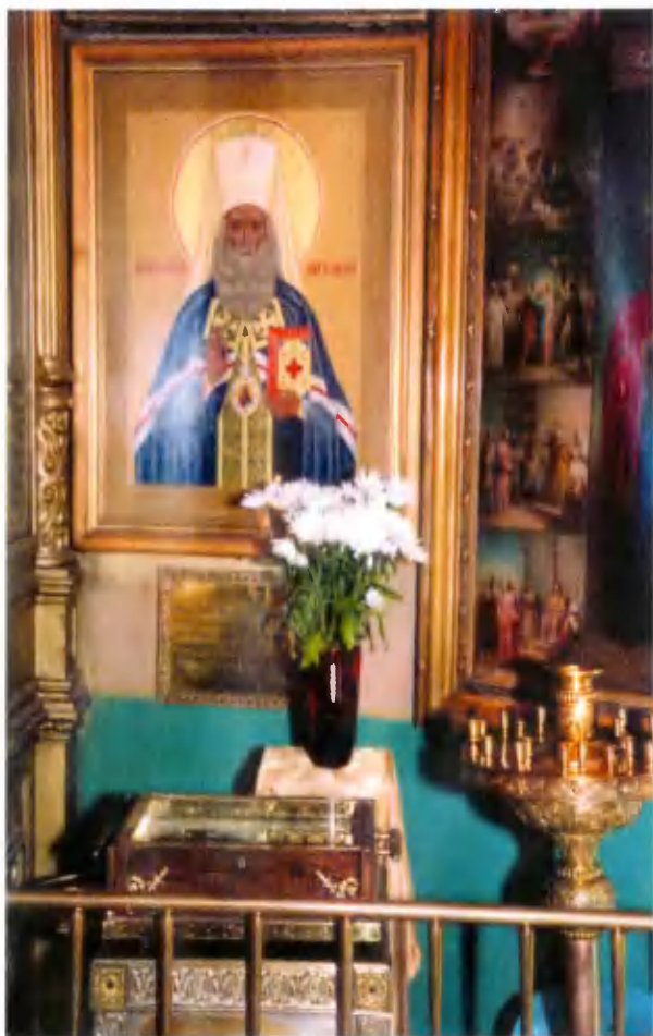
Мошевик на месте захоронения Евдокии Никитичны Дроздовой, матери митрополита Филарета.

лей манифеста от 19 февраля 1861 г. об освобождении крестьян от крепостной зависимости.