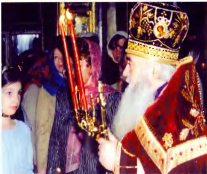
Пасхальная ночь (2004 г.)

В середине 90-х годов с приходом нового настоятеля митрофорного протоиерея Святослава Юримского (батюшки Святослава) (1936—2004), ревнителя строгого Православия и обрядового благочестия в Божьем храме, Церковь еще более окрепла духовно, обогащенная всеми правилами ведения богослужений согласно апостольским канонам с обязательным чтением акафистов.