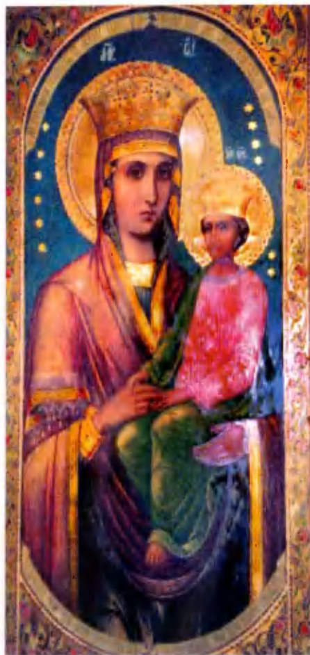
Икона Божией Матери «Споручница грешных».

Все это происходило, несмотря на государственный декрет, который устанавливал неприкосновенность церковной собственности на основании Закона «Об отделении церкви от государства», принятого в 1918 г. Советской властью. Кстати,