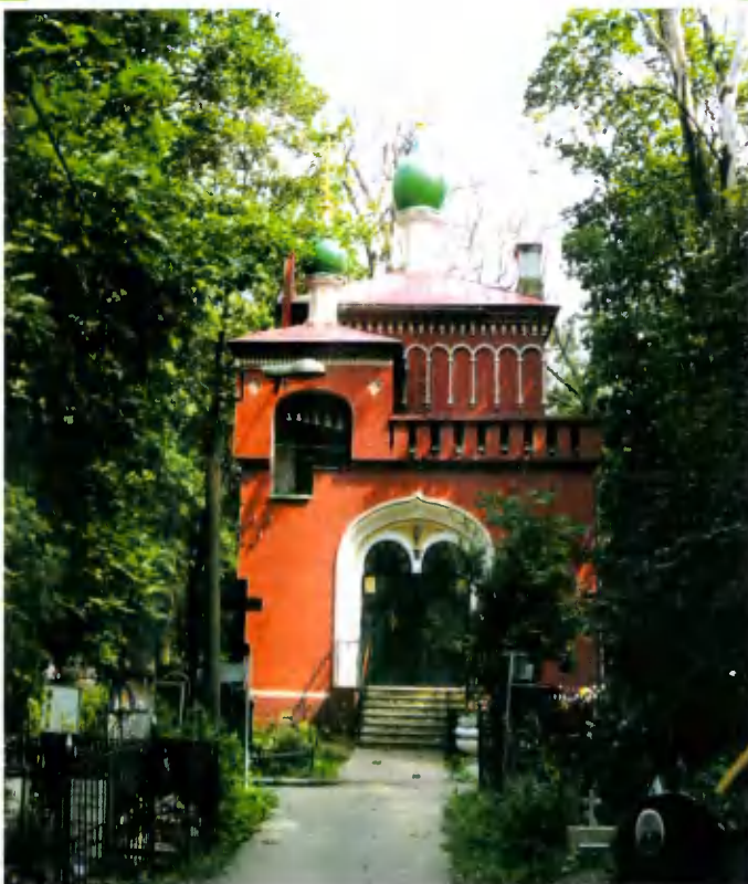
Восстановленная часовня с престолом в честь свмч. Симеона, епископа Персидского, освященная Святейшим Патриархом Алексием II в 2001 году.