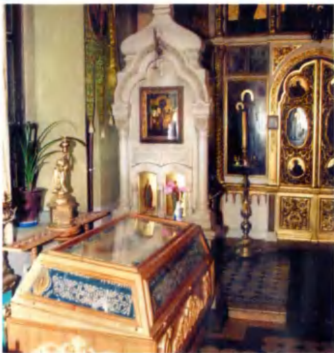
Придел прп. Сергия Радонежского. Плещаница Матери Божией.