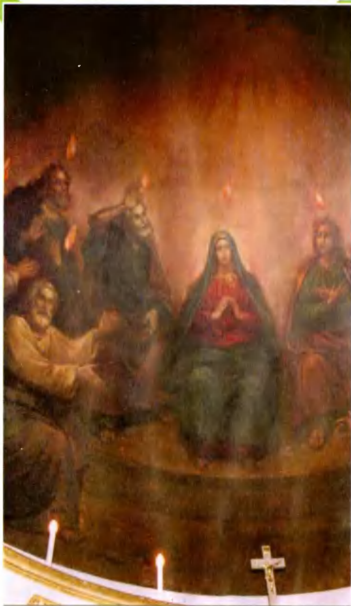
Фрагмент росписи купола над главным алтарем.