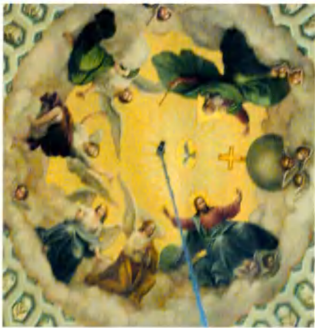
Роспись центральной части купола.

1980 годах часовню вернули церковной общине. Были проведены реставрационные работы, в результате которых внешний вид максимально приблизился к первоначальному варианту.