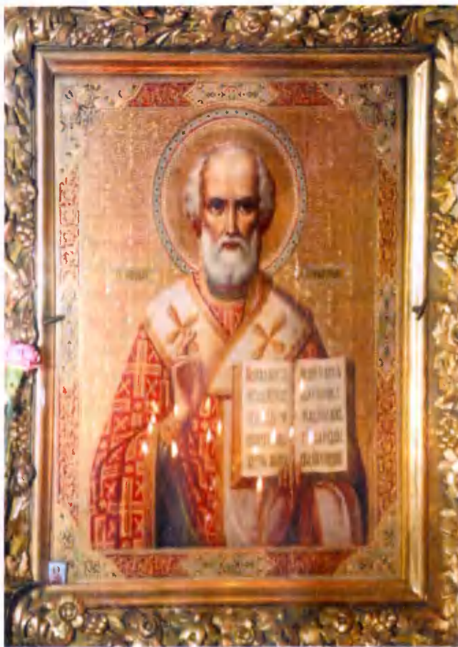
Икона свт. Николая, архиепископа Мир Ликийских чудотворца.

Еще в 20-е годы, под предлогом помощи голодающим, во многих храмах государство начало реквизи́ровать ценное церковное имущество. Из храма Святой Троицы 23 апреля 1922 г. было изъято: