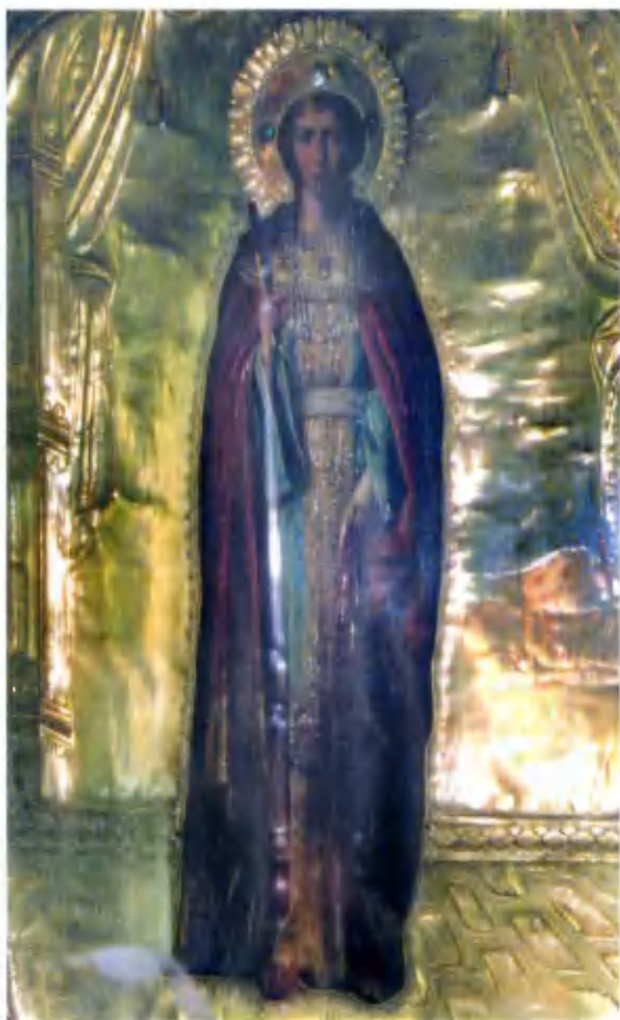
Икона мчнц. царицы Александры.