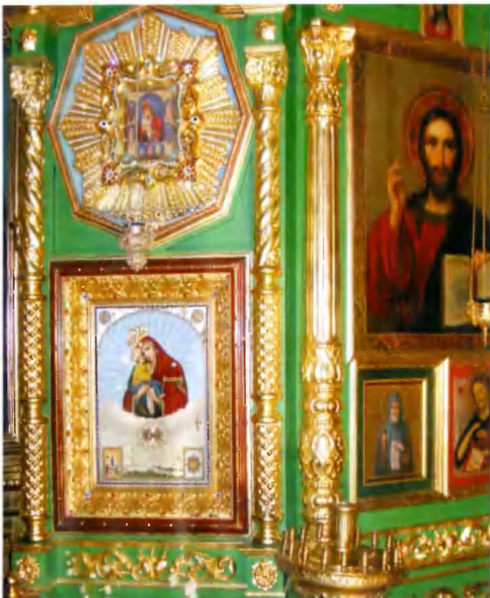
Вверху икона Божией Матери «Почаевская», копия иконы, находящейся в Почаевской Лавре. Внизу отреставрированная храмовая икона Божией Матери «Почаевская».

поклониться Богу, чтобы вечно мятущиеся наши души обрели покой и умиротворение. Люди нашли дорогу к Богу.