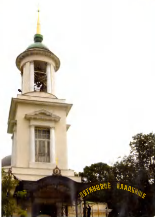
Вид Храма с Крестовского моста.

ших десятилетий. История его создания интересна и поучительна. В ней со всей очевидностью отразились все этапы развития духовной и, прежде всего, религиозной культуры нашего народа.